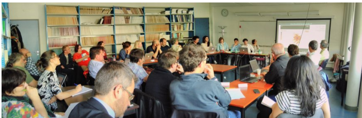
Atelier Prospectives urbaines et agricoles, 30 mars 2017, salle Darcy - UPMC

Une newsletter « nouvelle formule » a également été développée, dont le premier numéro a été diffusé en mai 2017. Exclusivement numérique et entièrement en HTML, la newsletter du PIREN-Seine sera diffusée tous les 4 mois, et fera le lien avec les actualités mises en ligne sur le site web du programme.