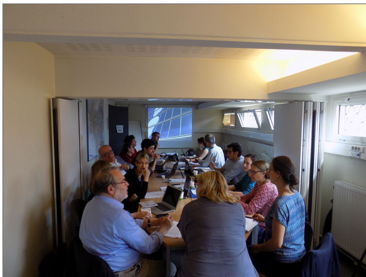
Comité de suivi, 30 juin 2017, salle Belgrand, Direction Eau et Assainissement, CD 93

Pour cela, le document prendra la forme de 15 questions définies conjointement par les référents scientifiques et opérationnels du groupe de travail Micropolluants. Elles aborderont la définition, les enjeux, les sources, les niveaux d'imprégnation des eaux urbaines, le devenir et le traitement des micropolluants, mais aussi les précautions liées à leur suivi.